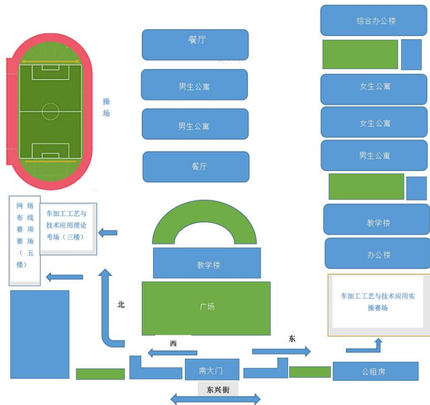
陕西省渭南工业学校赛点赛场导视图